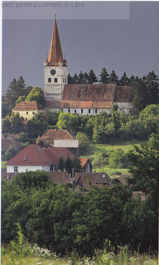
Biserica fortificată din Cincu / The fortified church in Cincu

O călătorie prin Transilvania ne conduce în miezul unei lumi diferite, cu burguri clădite după model german, biserici fortificate și numeroase monumente de arhitectură gotică, renescentistă și barocă. Atât satele, cu cetăți de tip țărănesc, cât și orașele, puternic fortificate odinioară, au devenit azi centre turistice animate.