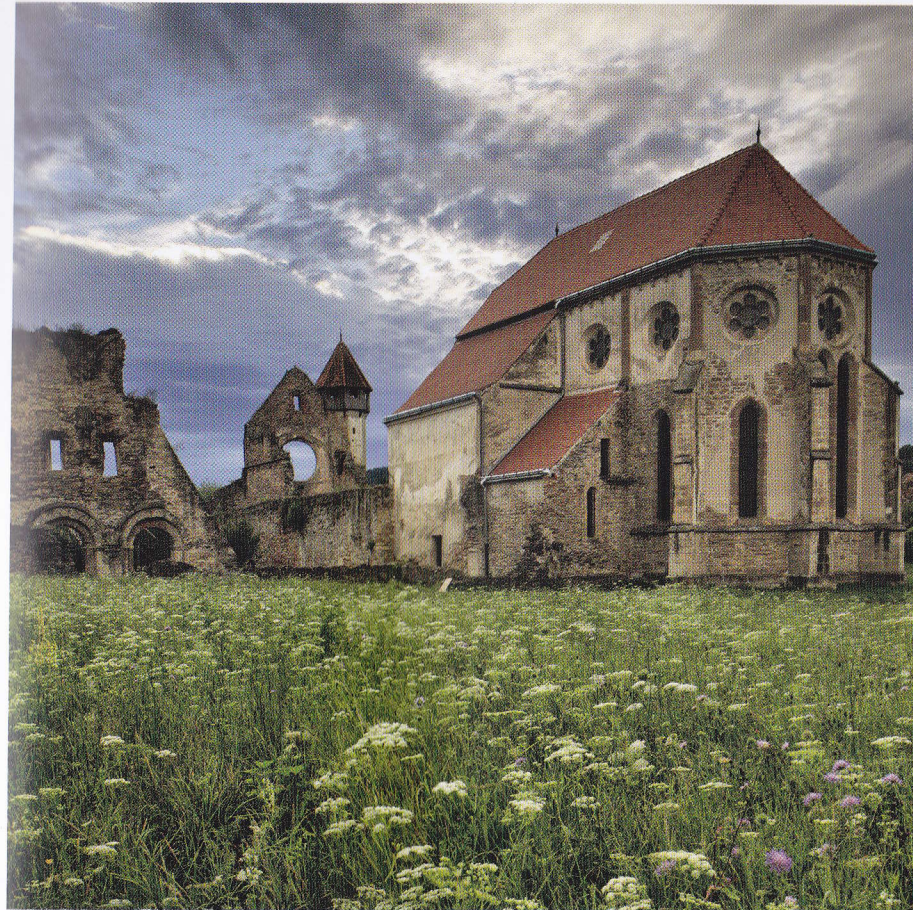
Abația cisterciană din Cârța (1202) / The Cistercian abbey at Cârța (1202)